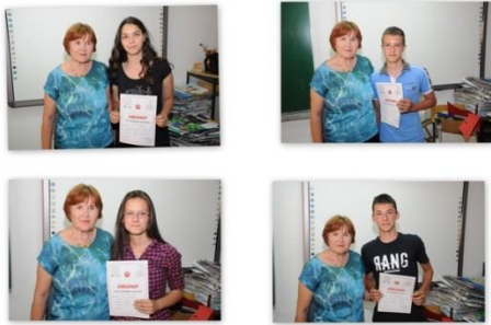
ДОДЕЛА ПРИЗНАЊА СА ОКРУЖНОГ ТАКМИЧЕЊА - ХЕМИЈА 10.6.2015.