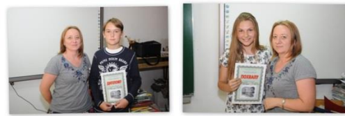
ДОДЕЛА ПРИЗНАЊА СА ОКРУЖНОГ ТАКМИЧЕЊА - ФИЗИКА 10.6.2015.