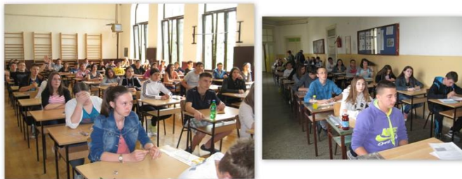
ПРОВНИ ЗАВРШНИ ИСПИТ - АПРИЛ 2015.

У свим основним школама на територији Републике Србије ученици осмог разреда, 24.04.2015. године (петак), у 12 часова, у оквиру пробног завршног испита полагали тест из математике, док су 25.04.2015. године (субота), у 9 часова, полагали тест из српског/матерњег језика, а у 11:30 часова комбиновани тест (биологија, географија, историја, физика и хемија).