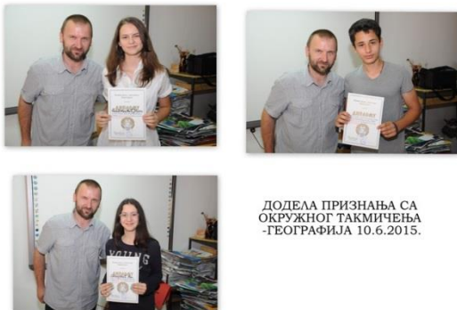
ДОДЕЛА ПРИЗНАЊА СА ОКРУЖНОГ ТАКМИЧЕЊА -ГЕОГРАФИЈА 10.6.2015.