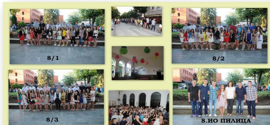
МАЛА МАТУРА - ГЕНЕРАЦИЈА 2000. (29.5.2015.)

На основу календара образовно-васпитног рада за основне школе , ученици 8. разреда у петак 29. маја 2015. Године су завршили друго полугодиште и исти дан одржана прослава мале матуре у спортској сали наше школе уз дефиле улицама града.