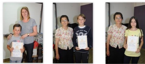
ДОДЕЛА ПРИЗНАЊА СА ОКРУЖНОГ ТАКМИЧЕЊА - МАТЕМАТИКА 10.6.2015.