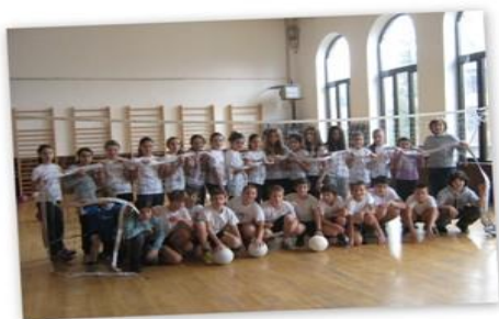
ДОНАЦИЈА ПОРОДИЦЕ МАНТЕЛ - НОВЕМБАР 2014.

12.11.2014. Привредно друштво „Дринско-Лимске хидроелектране“ д.о.о Бајина Башта донирало је школи 50.000,00 динара од тог новца набавили смо папир за фотокопирање.