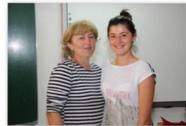
ДОДЕЛА ПРИЗНАЊА СА ОКРУЖНОГ ТАКМИЧЕЊА - АТЛЕТИКА 10.6.2015.