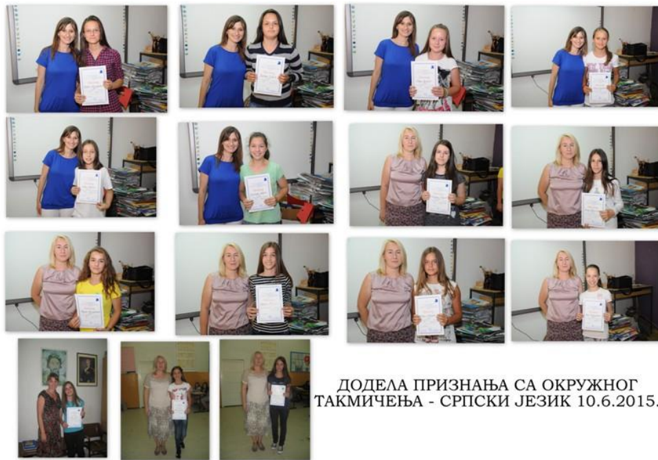
ДОДЕЛА ПРИЗНАЊА СА ОКРУЖНОГ ТАКМИЧЕЊА - СРПСКИ ЈЕЗИК 10.6.2015.