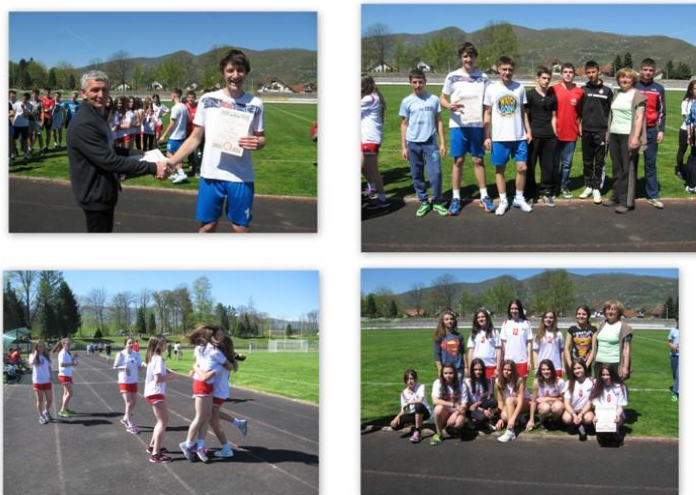
23.4.2015. ОПШТИНСКО ТАКМИЧЕЊЕ У АТЛЕТИЦИ