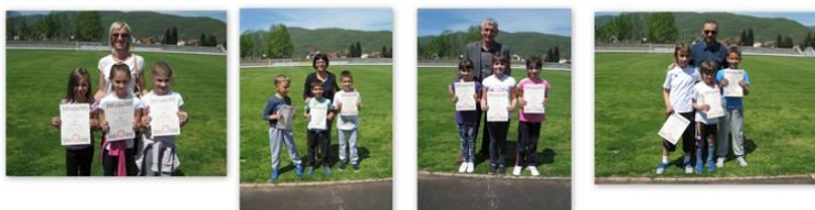
ПОВЕДНИЦИ ПРОЛЕЋНОГ КРОСА ОД 1. ДО 4. РАЗРЕДА - 30.4.2015.