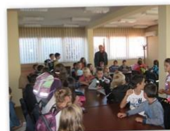
ДЕЧЈА НЕДЕЉА 2014. ЧЕТВРТИ РАЗРЕД

У оквиру Дечје недеље ученици Основне школе „ Рајак Павићевић“ издвојено одељење Пилица припремили су низ активности којима су показали да њихова срећна лица чувају њихове породице. Први дан Дечје недеље 6.10.2014. одржана је представа у биоскопу „ВЛАЈА“ Вашар у Тополи. Ученици другог, трећег, четвртог, петог и седмог разреда показали су своје глумачке способности и уједно су имали жељу да сачувају нашу традицију и обичаје. Трећи дан 8.10.2014. обележила су спортска такмичења у надвлачењу конопца, забавни полигон и разбијање пињате. Четврти дан 9.10.2014.