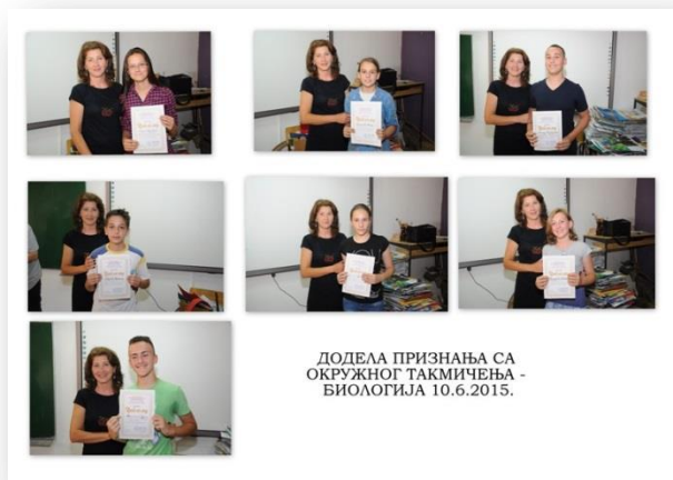
ДОДЕЛА ПРИЗНАЊА СА ОКРУЖНОГ ТАКМИЧЕЊА - БИОЛОГИЈА 10.6.2015.