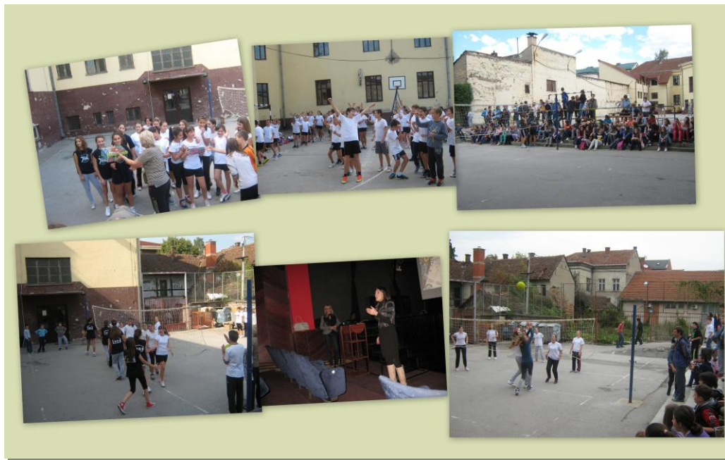
/Дечја недеља – ученици од 5. до 8. разреда/

Дечја недеља почела 07.10.2013. и трајала до 13.10.2013. под геслом „Слушајте мама и тата желим сестру ил' брата“. Активности за ученике од петог до осмог разреда су се одвијале по следећем распореду: Понедељак – Одбојка 8.разред девојчице - победници 8/3 ;Уторак – Одбојка 7. разред девојчице – победници 7/1 ; Среда – Одбојка 6. разред – победници 6/2 ; Гађање у мету ученици 5. разреда ; Четвртак - Одбојка 7. разред дечаци – победници 7/1 , Предавање за девојчице 7. разреда о репродуктивном здрављу ; Предавање за родитеље ученика од 5. до 8. разреда у сали биоскопа «Влаја» на тему «Трговина људима и злоупотребе глобалних друштвених интернет мрежа» ;Петак - Одбојка 8. разред дечаци – победници 8/1 ; Хуманитарна акција „Нама краће другима слађе“ .