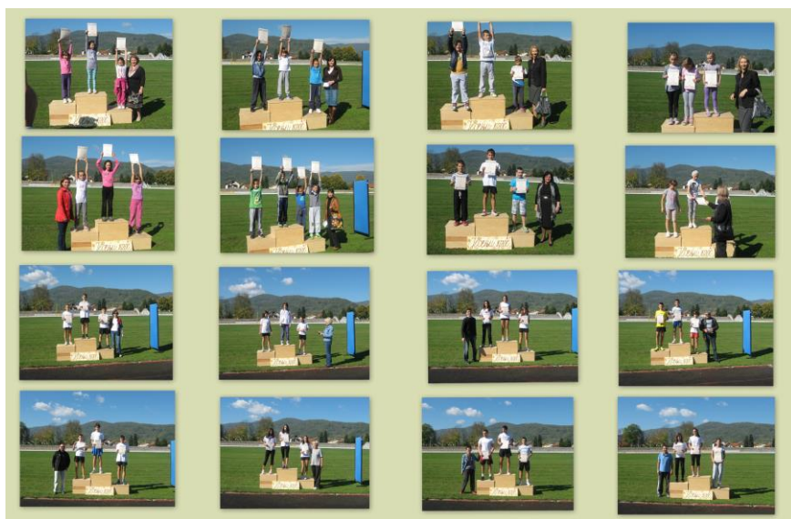
/Победници јесењег кроса одржаног 18.10.2013./