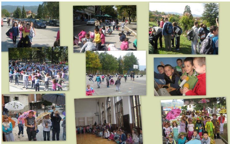
/Дечја недеља – ученици од 1. до 4. разреда/

Хуманитарна акција „Нама краће другима слађе“.